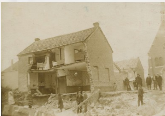
Meers na de dijkdoorbraak op oudjaarsdag 1925.